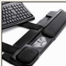
Dispositif de pointage